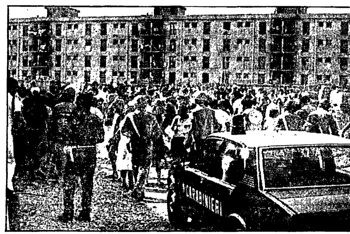
Occupazione di alloggi nel rione Secondigliano. Interviene la polizia. Una delle cucine da campo approntate a Licola.

Gli stabili sfitti individuati nell'entroterra flegreo - I primi alloggi assegnati ieri sera. Le scuole occupate dai terremotati. Delegazione PCI in visita alla città