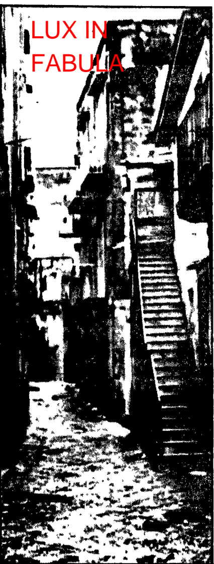
Un'immagine del «rione Terra» a Pozzuoli, deserto dopo lo sgombramento