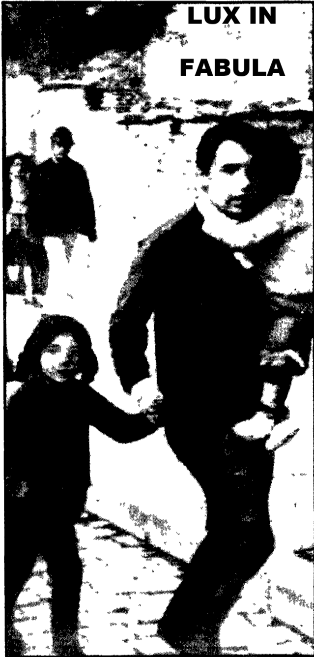
POZZUOLI un'immagine del drammatico esodo dal «rione Terra»

«Sono cinquant'anni che ci promettete una casa nuova»: con queste parole sono state accolte le autorità nazionali e locali dai pescatori puteolani del «rione Terra» - Niente era pronto per ricevere quei pochi che hanno ceduto alle promesse e sono andati all'ospedale