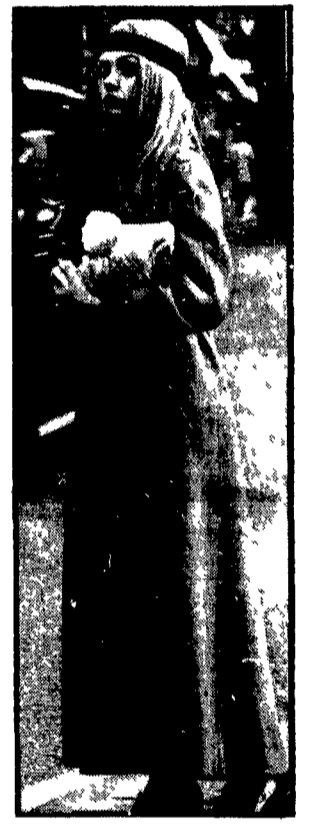
Sembra che, questa volta le case di moda non ce la facciano ad imporre un rapido cambiamento. In fatto, almeno, di gonne. La « mini », infatti, sta resistendo vittoriosamente agli assalti lanciati dagli inventori — si fa per dire — delle « maxi » che tentano di imporre (per chi può) il totale mutamento del guardaroba nei prossimi mesi. E nemmeno i soliti mediatori che hanno proposto una « midi-gonna » le cui misure oscillano intorno al ginocchio, sono riusciti a modificare la situazione. Il risultato dello scontro è che sono valide tutte le possibili varianti, come illustrano le foto. Per la prima volta, nella più recente vicenda della moda femminile, l'orlo della gonna potrà essere indifferente a più di 70 centimetri dal suolo, oppure a poche dita, senza che nessuno si senta « fuori moda ».