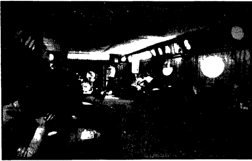
L'interno del « New sporting club », più simile a un bar che a una « fumeria »

Nessuna visita medica per i dieci giovani trovati in stato soporoso - Il quadro terrificante descritto da certi giornali - 800 grammi fra stupefacenti ed eccitanti sequestrati nei locali del circolo - Iniziativa del provveditore agli studi - Il vero problema: perchè?